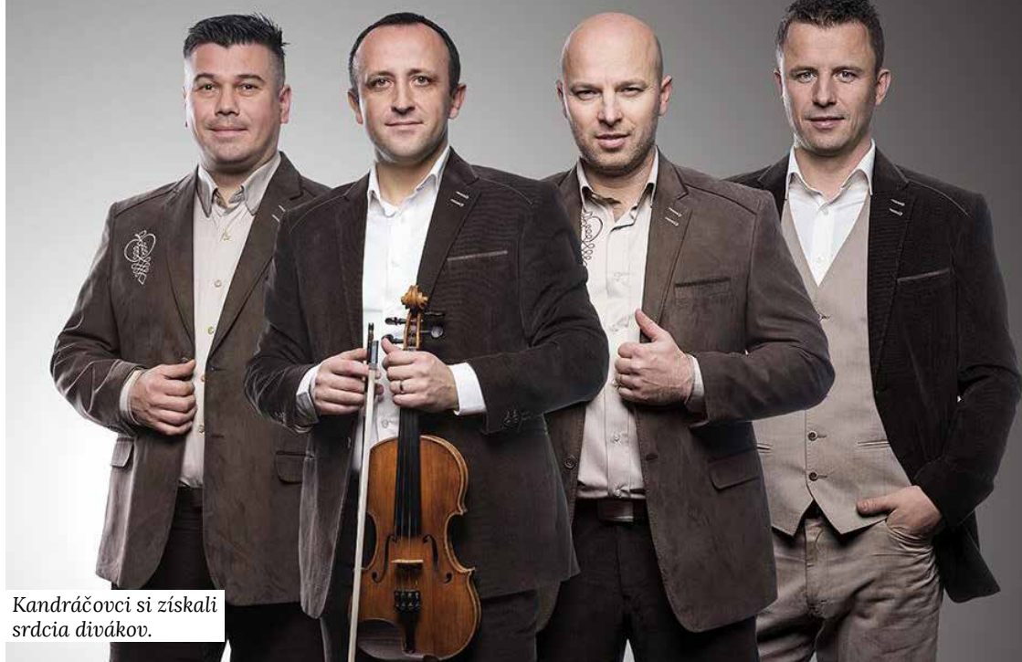
Kandráčovci si získali srdcia divákov.

- Radi si s manželkou dáme pár kilometrov na bežkách, z domu vo Vyšnom Lorinčíku hore na Bukovec, keď hráme v končinách, kde je dosť snehu, pribalím si k husliam bežky. Rád si zahrám s kamarátmi aj bedminton. A potom mám